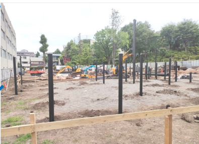
R6.05 杭による地盤強化