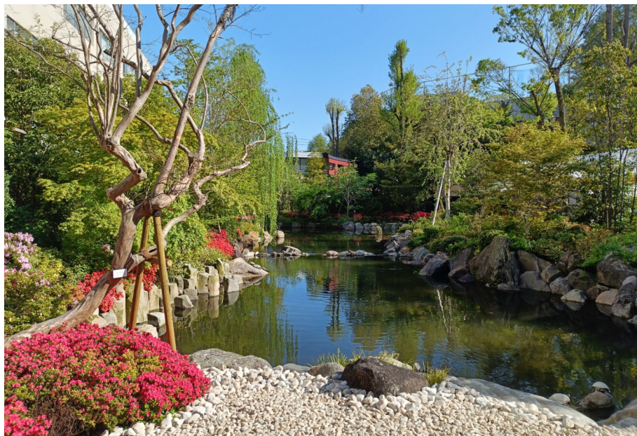
広間からのお庭の眺め