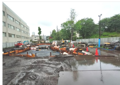
R6.03 整地・既存池撤去